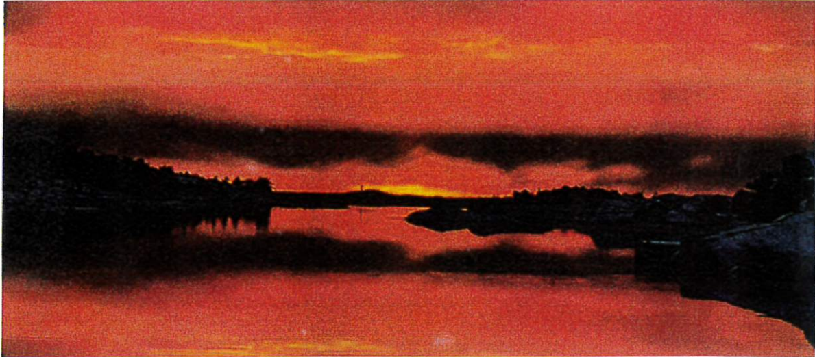
Fotograf Ullriche Gade